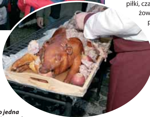
Pieczony prosiak to jedna z wielu atrakcji kulinarnych.