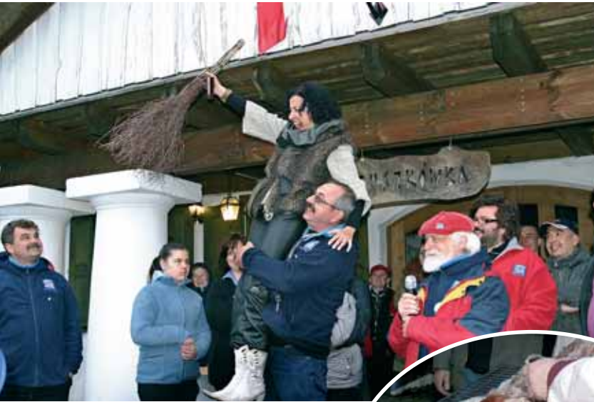
Zlicytowana została nawet stara miotła, która akurat była pod ręką – szczęśliwy jej nabywca zapłacił 70 zł.