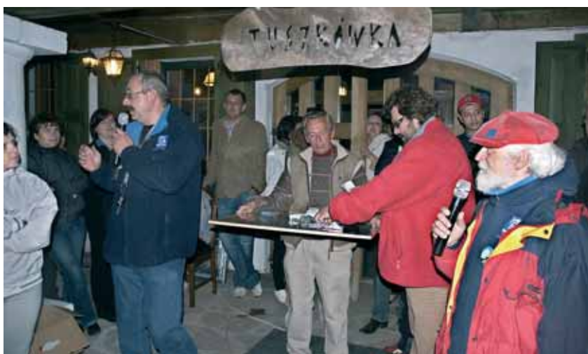
Kwota zebrana podczas licytacji przekazana została dzieciom z Ożarowskiego Stowarzyszenia Pomocy Osobom Niepełnosprawnym im. Jana Pawła II.

Organizatorzy, firma Henrys Group, generalny przedstawiciel P.L.A. na Polskę, zapewнили gościom wiele atrakcji, m.in. wycieczkę autokarem do Centrum Nauki Kopernik w Warszawie (ciekawe doświadczenie nie tylko dla dzieci), konkurs strzelania z łuku i broni pneumatycznej, ścianka wspinaczkowa, a także miastecz-