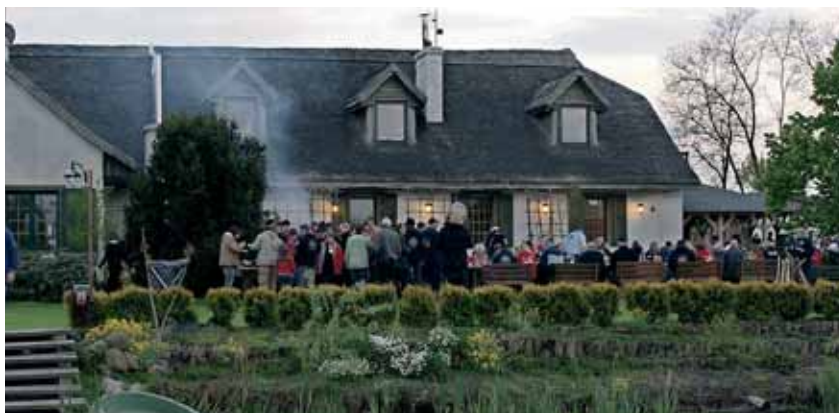
Nowy kemping K1 położony jest w bardzo urokliwym miejscu.

W dniach 6-8 maja br. odbyło się w Kaputach pod Warszawą uroczyste otwarcie kempingu K1 – pierwszego z powstającej sieci kempingów Henrys Group. Impreza połączona była ze zlotem zorganizowanym dla klubów carawaningowych.